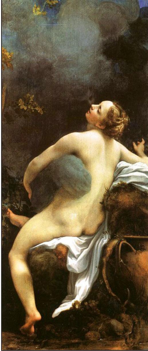
'Jupiter og Io' av kunstneren Antonio da Correggio fra 1532-1533. Kunsthistorisches Museum i Wien. Legg merke til likhetene mellom skulpturen til Kai Nielsen og maleriet til Correggio, og spesielt bevegelsene i kroppene, og deres plassering overfor hverandre.